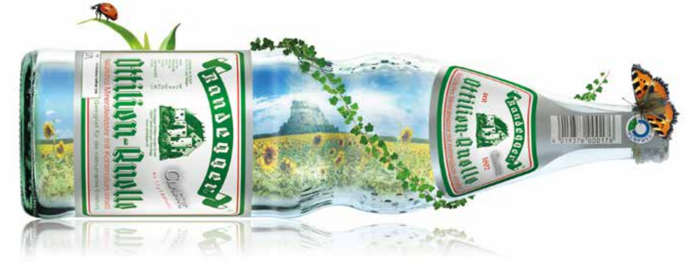
Perlenflasche: Kooperativ entwickelt – über 50 Jahre am Markt

Die Perlenflasche erhielt 2019 den 'German Design Award' in Gold, den renommiertesten Designerpreis Deutschlands: Ein Aufruf zur Trendumkehr nicht nur an die restlichen Getränkeproduzent*innen, sondern auch an produzierende Unternehmen in anderen