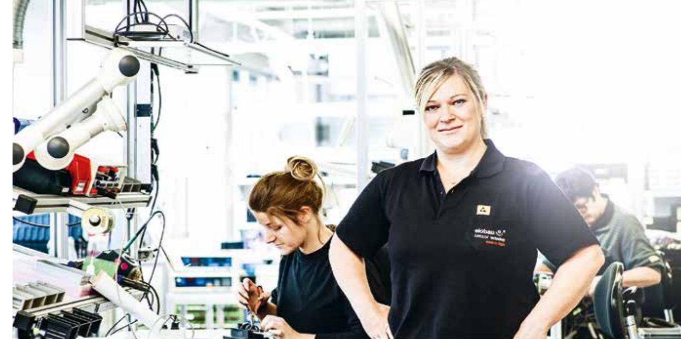
elobau verzichtet bewusst auf alle gefährlichen und giftigen Stoffe in seinen Produkten

Werkstoffe und Konstruktionsmethoden untersucht und eingesetzt, die die ökologische Nachhaltigkeit der Produkte verbessern. Im hauseigenen Prüflabor können Umwelteinflüsse simuliert werden und so eine möglichst lange Lebensdauer der Produkte (20.000 Betriebsstunden, das entspricht einer Lebensdauer von etwa zehn Jahren) gewährleistet und dadurch schädliche Umweltauswirkungen reduziert werden. elobau verzichtet bewusst auf alle gefährlichen und giftigen Stoffe in seinen Produkten und achtet konstant darauf, ob weitere Materialien als problematisch (nach Reach oder RoHS) eingestuft werden. Die Basistechnologie 'Reed in Sensoren' ist per se langlebig, da sie ohne Versorgungsspannung auskommt und daher als sehr energieeffizient zu bewerten ist. Eine modulare Bauweise sowie eine Trennbarkeit der Teile gewährleisten Reparaturfreundlichkeit bzw. eine Wiederverwertung nach Sorten. Vor allem Teile mit hohem Verschleiß werden so entwickelt, dass sie austauschbar sind. Produkte werden in der Regel