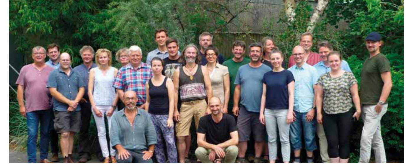
Runder Tisch Getreide 2019

wirtschaft noch die der Bäckereien widerspiegeln. Die vereinbarten Festpreise für Roggen, Weizen und Dinkel sollen den Höfen ein faires Einkommen sichern und gleichzeitig angemessene Rohstoffpreise für die Bäckereien darstellen, um es vielen Menschen zu ermöglichen, qualitativ hochwertiges Brot zu kaufen. Seitdem legen die Landwirt*innen am 'Runden Tisch Getreide' die Preise gemeinsam fest. Passt die Vereinbarung für eine*n Geschäftspartner*in im Laufe des Jahres nicht mehr, so wird die Runde einberufen und es wird neu verhandelt. Auch wenn aufgrund von externen Faktoren (z.B. Ernteauffällen) bestehende Zusagen nicht eingehalten werden können, wird gemeinsam nachverhandelt. Eine gute und verbindliche Zusammenarbeit steht im Mittelpunkt der Beziehungen , nicht der schnelle Euro für die eine oder andere Seite. Wie in den fair & regional-Kriterien des Märkischen Wirtschaftsverbundes vorgesehen, stimmen die Landwirt*innen zum Abschluss des 'Runden Tisches Getreide' anonym darüber ab, ob die gemeinsamen Handelsbeziehungen als fair bewertet werden und Märkisches