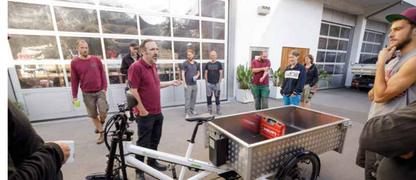
Betriebsentscheidungen im Konsens

getroffen! Wenn nötig, lassen sich die Beteiligten Zeit, um Einwände ernst zu nehmen und als Chance im Ringen um die beste Entscheidung zu verstehen. Die wichtigen Themen des laufenden Betriebes werden in der monatlichen Leiter*innenversammlung (Abteilungsleiter*innen, Geschäftsführung und Ausbilder*in) besprochen und entschieden. Zwar sind viele Verantwortungsträger*innen auch Gesellschafter*innen; offene Stellen im Betrieb, auch Führungspositionen, werden jedoch unabhängig davon besetzt, ob jemand Gesellschafter*in ist. Alle wichtigen Positionen im Betrieb sind mit Doppelspitzen besetzt. Das bewahrt davor, einseitige Entscheidungen zu treffen, die gegebenenfalls nicht angemessen sind. Zudem lässt sich hierüber besser austarieren, wer eher mitarbeitenden- und wer eher kund*innenorientiert denkt. Macht ist bei Blattwerk kein Selbstzweck, sondern Dienst an der Gemeinschaft und soll auf möglichst viele Schultern verteilt werden. Zusätzlich zu den Zusammenkünften der Gesellschafter*innen und Leiter*innen gibt es noch ein bis zwei Abteilungs-