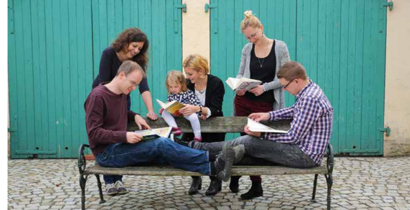
Hobby, Arbeit und Familie zusammen – das Buch7-Team © buch7

können auch kleine Vereine oder Gruppen unterstützt werden, die andere Fördermittel, wegen bürokratischer Hürden, nicht in Anspruch nehmen können. Beispiele geförderter Projekte: Das Inselhaus – Kinder- und Jugendhilfe in Eurasburg – hilft Kindern, die benachteiligt und durch familiäre Umstände in ihrer Entwicklung beeinträchtigt sind; foodwatch, die Lebensmittelskandale aufdecken; in Langweid, dem Firmensitz des Unternehmens, wurde der alte Bahnhof renoviert und ein gemeinnütziges Kulturzentrum gegründet. 2013 stieg der Umsatz auf 125.000 Euro, so dass der erste Gründer festangestellt werden konnte. Heute ist buch7 ein Unternehmen mit 14 Mitarbeitenden, über drei Millionen Euro Umsatz und einer kumulierten Spendenleistung von über 600.000 Euro, das entspricht etwa 75 Prozent des Gewinns. Trotz dieses Wachstums lebt das Team von buch7 weiterhin seinen idealistischen Traum, Spenden für wertvolle Projekte sozusagen aus dem „Nichts“ zu