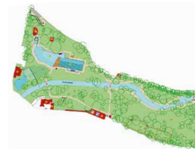
Im Naturbad Maria-Einsiedel wird das Badewasser im separat angelegten Regenerationsteich auf rein biologische und mechanische Weise gereinigt. Als sauberes, weiches Wasser fließt das Badewasser zurück in den Schwimm- und Kinderteich.

Branche: Kommunalbetrieb Mitarbeitende: 283 inkl. Saisonkräfte (VZÄ) Ort: München (DE) www.swm.de/baeder