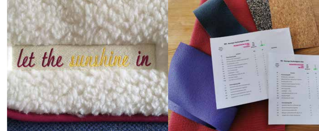
Bewertung nach Bausinger-Nachhaltigkeits-Index (BNI) © Bausinger

schuks dieser Erde in Monokulturen auf Kautschukplantagen in Malaysia und Indonesien hergestellt werden, mit einem hohen Einsatz an Insektiziden und Pestiziden, Degradierung der Böden und überdurchschnittlich hoher Erosion während des Monsunregens. Viele Plantagenarbeiter*innen haben gesundheitliche Probleme durch eingesetzte Spritzmittel. Bei der Vulkanisierung von Kautschuk entstehen Nitrosamine, die im Verdacht stehen, krebserregend zu sein. Hinzu kommt, dass Naturlatex unter UV-Einstrahlung leicht zerbröseln. Mit Zugaben von Acrylaten und Weichmachern wird die Lebens- und Nutzungsdauer verlängert, allerdings dünstet der Weichmacher mit der Zeit aus (daher der typisch säuerliche Geruch von Naturgummi-Produkten). So enthalten nach Bausingers Recherchen Naturkautschukmatten etwa dreißig Prozent Acrylate und Weichmacher sowie ein Glasfasergewebe (PES-Gewebe). Die Verarbeitung erfolgt vor allem in China und in Taiwan. Alleine die