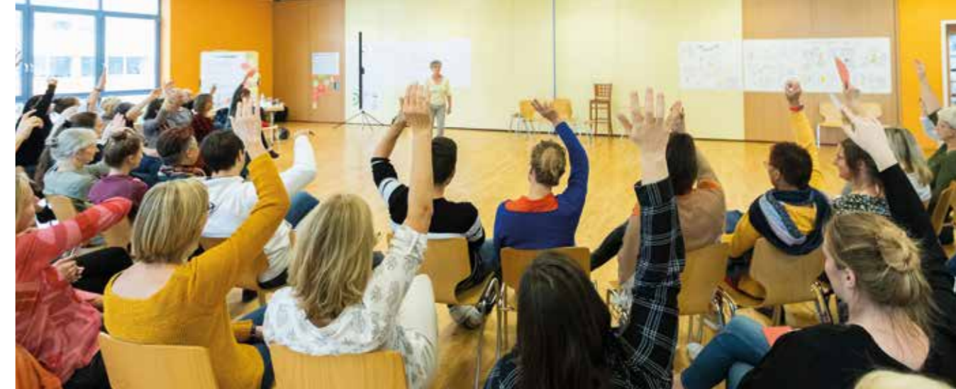
Die Mitarbeitenden sind beteiligt an Erfolg, Kapital und Entscheidungen.

die von Mitarbeitenden geführte bioverlag-Stiftung einspringen. Außer des monatlichen Bruttogehalts erhalten Mitarbeitende eine Erfolgsbeteiligung, welche gemeinsam auf Basis des Jahresabschlusses vereinbart wird. Diese wird im Verhältnis zur geleisteten Arbeitszeit ausgezahlt, was sich nivellierend auf das Gehaltsniveau auswirkt. Aktuell ist das höchste Gehalt im Verlag knapp dreimal so hoch wie das niedrigste. Die Mitarbeitenden haben für sich 35 Stunden als volle Wochenarbeitszeit definiert , u.a. um mehr Menschen beschäftigen zu können, und sie möchten sich selbst eine flexible Wochenarbeitszeit ermöglichen. Um dieses Ziel mit den gemeinschaftlichen und geschäftlichen Bedarfen in Einklang zu bringen, hat sich eine differenzierte Praxis zur Arbeitszeitorganisation entwickelt: Grundsätzlich können alle Mitarbeitenden unter Berücksichtigung der Arbeitserfordernisse in Abstimmung mit der Geschäftsleitung und den direkten Kolleg*innen ihre Arbeitszeit flexibel und ohne Kernzeit selbst organisieren. Für die notwendige Abstimmung in den Teams gibt es kein formelles