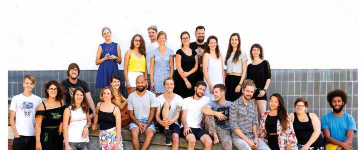
„Wir wollen uns als ganzer Mensch zeigen können, mit allem was so da ist, und trotzdem unsere Aufgaben wirklich ernst nehmen und Dinge massiv voranbringen.“

kräfte im klassischen Sinne. Alle Aufgabenbereiche sind in Rollen aufgeteilt. Rollen haben einen Zweck und mehrere Zuständigkeiten. Diese werden von der Person ausgefüllt, die aktuell am besten dafür geeignet scheint. Operative Entscheidungen liegen grundsätzlich dort. Entscheidungen, die Mitglieder kollektiv betreffen, wie etwa Budgets, das Lohnsystem, Einstellung und Entlassung von Kolleg*innen, betriebliche Innovationen, aber auch strategische Entscheidungen werden in strukturierten Meeting-Prozessen über die „integrative Entscheidungsmethode“ getroffen. Diese Methode erlaubt es allen, eine so genannte „Spannung“, die eine Lösung fordert, in den monatlich stattfindenden Governance-Prozess einzubringen. Spannungen können nicht per Veto oder Mehrheitsentscheid zum Verstummen gebracht, sondern müssen über Lösungsvorschläge und gegebenenfalls weitere Einwände integriert werden. Hier greift eine Moderation, die auf gleiche Rederechte und qualifizierte Einwände achtet. Denn jede/r muss sich mit Einwänden auf die